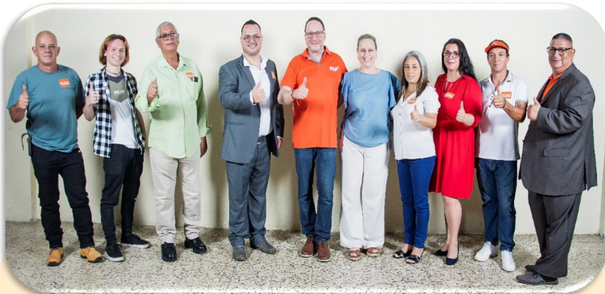
Concejales de distrito de nuestro cantón 2024-2028.