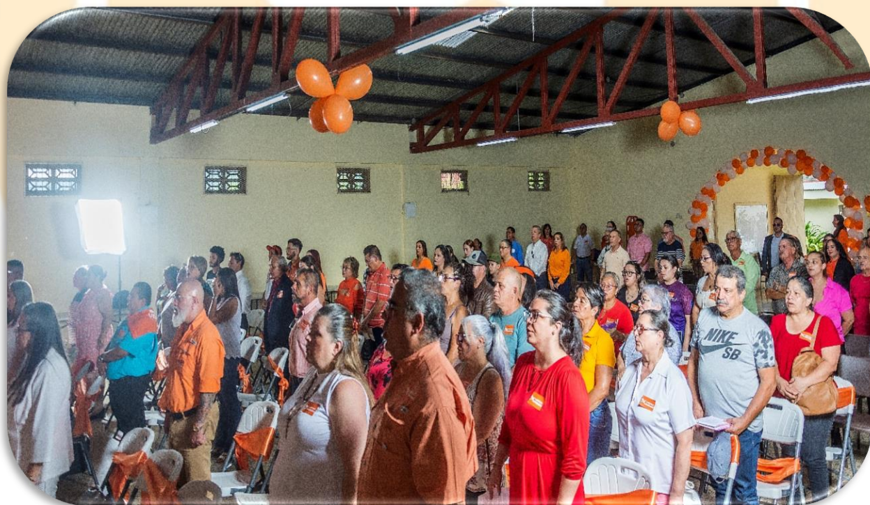
Asamblea Cantonal del PLP (2023).